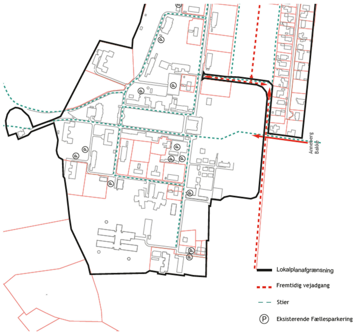
KORTBILAG 5: VEJE, STIER OG FÆLLESPARKERING. MÅL 1:5000